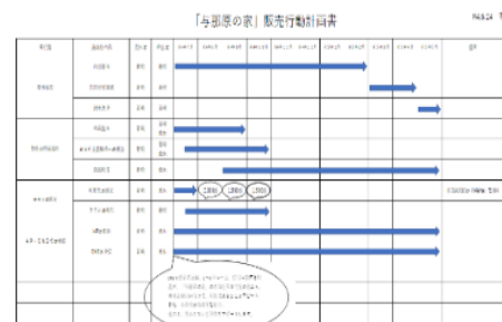
実際に作成したアクションプラン

☞ 当社、金融機関、よろず支援拠点、当協会とで「おきなわ経営サポート会議」を開催し、 当社の業況と支援情報の共有を実施