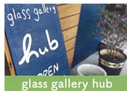
glass gallery hub