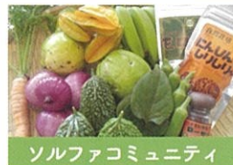
ソルファコミュニティ