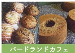
バードランドカフェ