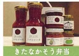
きたなかそう弁当