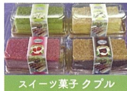
スイーツ菓子クプル