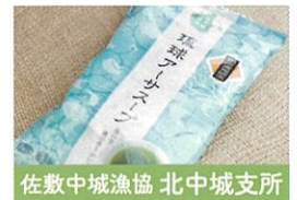
佐敷中城漁協 北中城支所