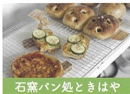
石窯パン処ときはや